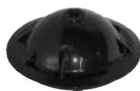
1 - SX0244K