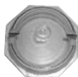
2 - G-15-4559