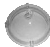
3 - G-15-2500