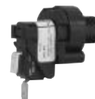
4 - MICROSWITCH