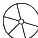
3 - G-C20E-12